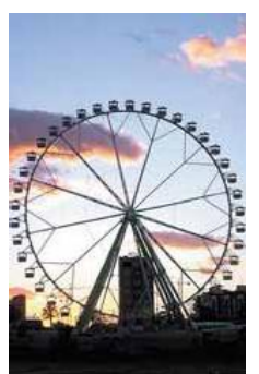
Habrà seis atracciones mayores.

En la Alameda colocarán seis atracciones mayores, diez infantiles y quince casetas como parte de la Feria de Julio. El horario será de 19 a 24 horas de lunes a jueves y hasta la 1.30 horas, de viernes a domingo.