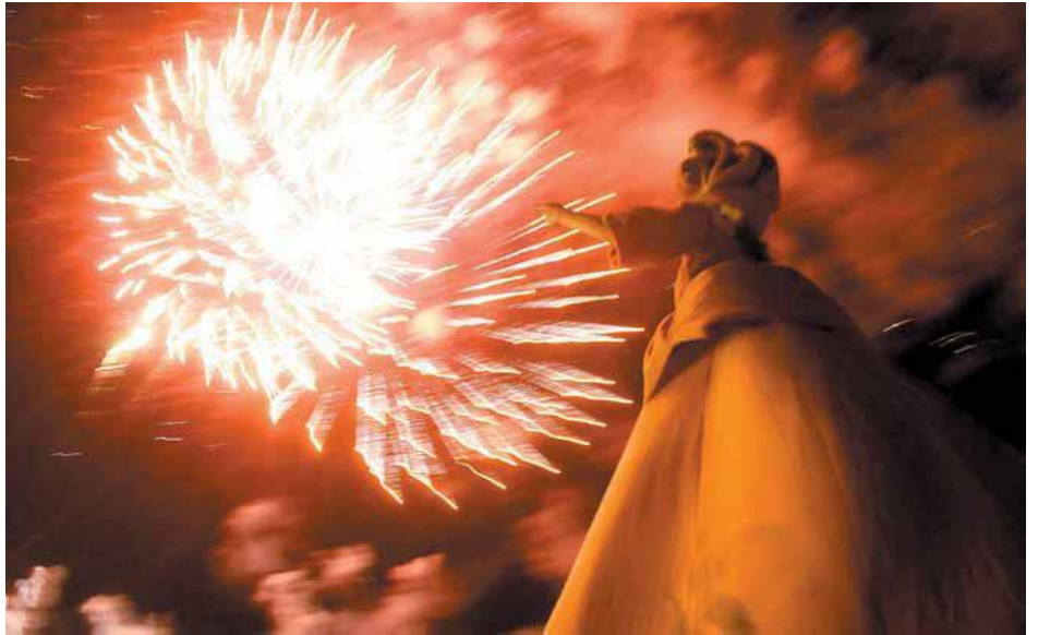
Como no puede faltar en ninguna celebración de Valencia, los fuegos artificiales tuvieron gran protagonismo en el Festival del Mar.

juzgada por una riña producida en 1997 a las puertas de una discoteca y un juzgado de Sagunt recibió unas diligencias abiertas por la Policía por "problemas vecinales". Aún así, la mujer tiene trabajo habitual, lleva 21 años en España, cotiza a la Seguridad Social y paga sus impuestos.